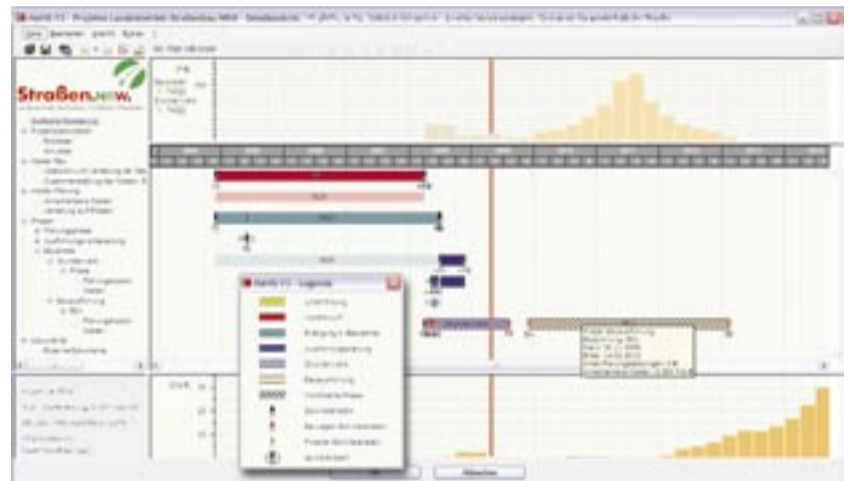
Detailsicht einer Maßnahme mit Modifikation und Legendarstellung.

FRECHEN. Infrastrukturprojekte wie Straßen, Tunnel und Brücken durchlaufen von der Bedarfserhebung bis zur Verkehrsfreigabe einen langen Zeitraum. Vorhabensträger müssen eine Vielzahl solcher Projekte mit ihren Abhängigkeiten und Erfordernissen im Überblick behalten. Dabei sind Auswirkungen von Termin- und Kostenabweichungen frühzeitig zu realisieren und bei Budget- und Zeitplanungen zu berücksichtigen. Die fpi fuchs Ingenieure GmbH aus Frechen bietet nun mit MaViS ein für das Controlling von Infrastrukturprojekten des Bundes, des Landes und der Kommunen entwickeltes Multiprojektmanagementsystem. Das unter Windows laufende Programm wurde in Kooperation mit dem Landesbetrieb Straßenbau NRW entwickelt.