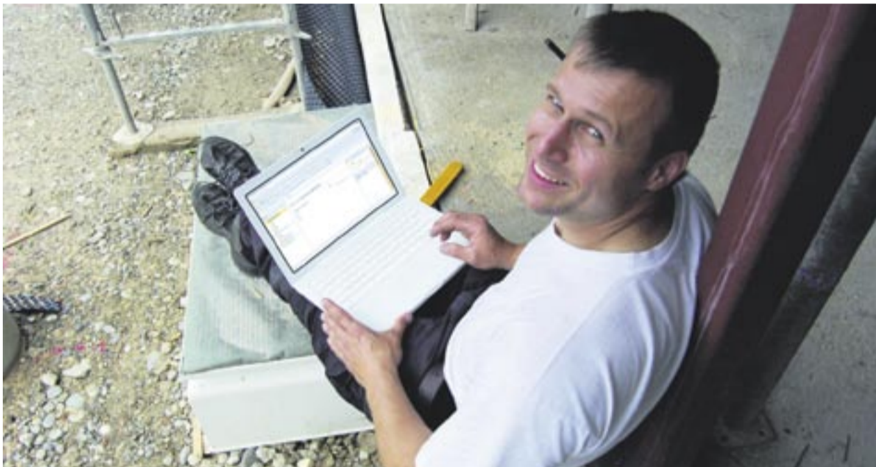
Bauhandwerker können mit der erweiterten Online-Software „Handwerksbüro live plus“ die Wirtschaftlichkeit ihrer Angebote prüfen.

nebeneinander stellen und so die Gründe für eine Unstimmigkeit feststellen. Alle Auswertungen in der Angebots- und Ausführungsphase sowie nach Abschluss des Bauvorhabens sind so mit wenigen Klicks erstellt. Ein umfassendes Controlling der Kosten ist folglich mit geringem Aufwand möglich. Unter www.handwerklive.de finden sich weitere Informationen im Internet zu „Handwerk live“. Das Weka-Angebot für das Bauhandwerk umfasst Software-, Online- und Printprodukte sowie eine modular aufgebaute, seit neuestem auch internetbasierte Handwerkersoftware und Seminare. Die Schwerpunkte sind dabei Softwareprodukte, die sich an den Kernprozessen der Bauhandwerker orientieren sowie gewerkespezifische Fachinformationen in den Bereichen Baurecht, Ausführungen und Normen.